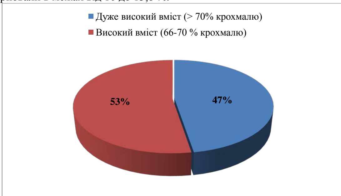
Рис. 2. Розподіл зразків колекції за відсотковим вмістом крохмалю, 2019 р.

14 із 38 ліній характеризувались високим вмістом білка, а 24 лінії – середнім вмістом. До групи із високим вмістом білка увійшли лінії: АЕ 464, АЕ746, АЕ 801, G 255, УХК 669, НЛГ 1239, ВК 13 та ін. В загальному показники вмісту білка варіювали в межах від 10 до 13,8 %.