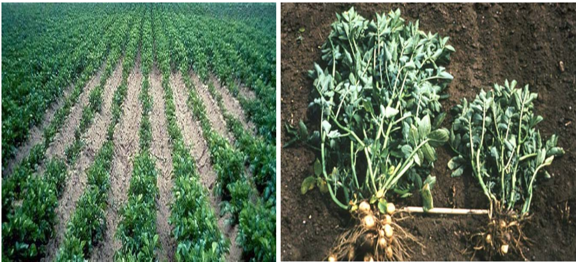
Рис. 1. Галевини пошкоджених рослин картоплі та самі пошкоджені рослини, спричинені золотистою картопляною нематодою [4].

На корінцях рослини при обережному викопуванні можна побачити маленькі білі або золотисті кульки – цисти.