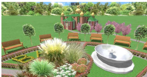
Рис. 3. Використання злакових трав під час створення клумб