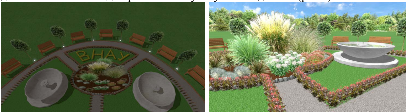
Рис. 5. Візуалізація водних пристроїв на території храму Трьох Святителів ВНАУ

Під час проведення в українських храмах релігійних заходів у ландшафтному дизайні доцільно використовувати символіку води, яка в українській звичаєво-побутовій обрядовості сягає дохристиянських вірувань, а окремі її елементи вплетені в історичноусталені форми життєдіяльності краю. У дизайні символіка води проявляється у штучних водоймах (рис.5).