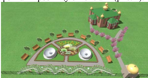
Рис. 2. Загальний вигляд проекту озеленення та благоустрою території храму Трьох Святителів ВНАУ

У процесі аналізу сучасного стану території встановлено, що загальна площа об'єкта озеленення становить 30 м 2 , під будівлею знаходиться близько 200 м 2 ; решту території займає партер і доріжки. Нині на території відбувається будівництво й ремонтні роботи у будівлі Храму. Проводиться ряд робіт внутрішнього оздоблення храму. Запроектовано два фонтани, розміщених симетрично навпроти центрального входу на храмову територію. Навколо фонтанів розміщуються лави (рис. 2).