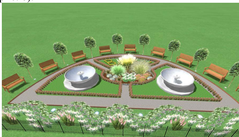
Рис. 6. Візуалізація проектного рішення на території храму Трьох Святителів ВНАУ

Загальна сума витрат на рослинний матеріал за цінами 2023 р. становить 49760 грн, водночас 56 % вартості становлять витрати на деревні рослини клену червонолистого (рис. 6).