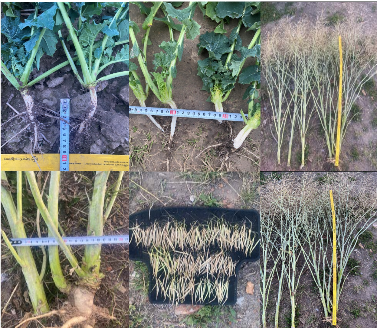
Рис. 2. Польова оцінка блоку морфоознак ріпаку озимого гібриду Абсолют (компанії Limagrain), 2023 рік.