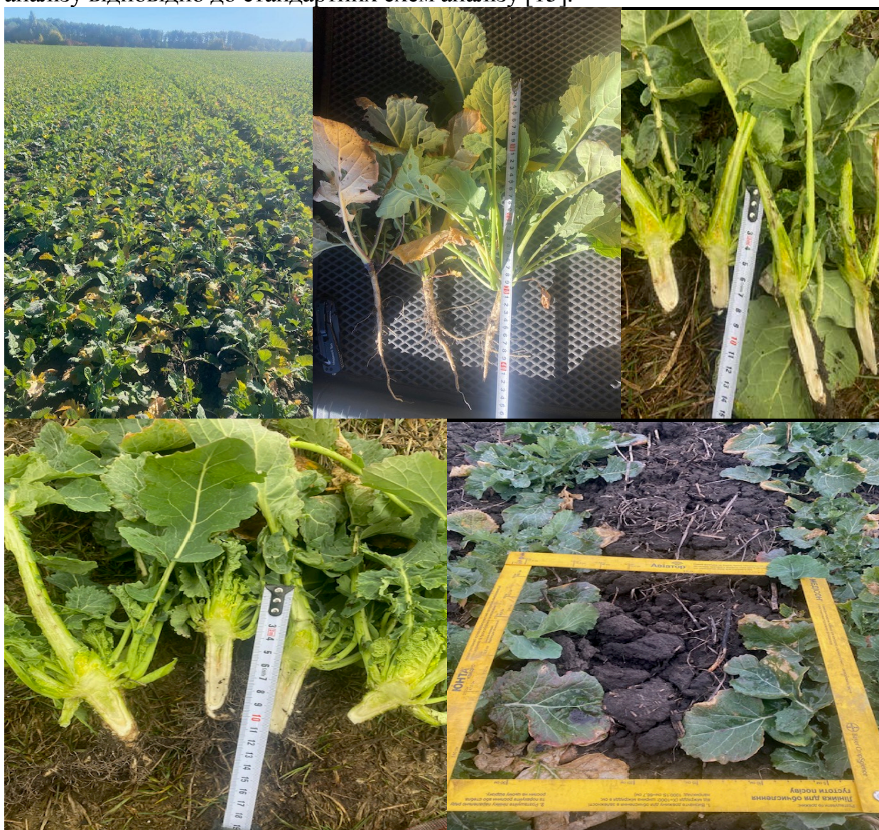
Рис. 2. Проведення обліків основних показників рослин озимого ріпаку у польових умовах, 2022–2024 рр.

Отримані дослідні дані піддавались статистичній обробці з використанням принципів та основ варіаційної статистики та дисперсійного багатофакторного аналізу відповідно до стандартних схем аналізу [15].