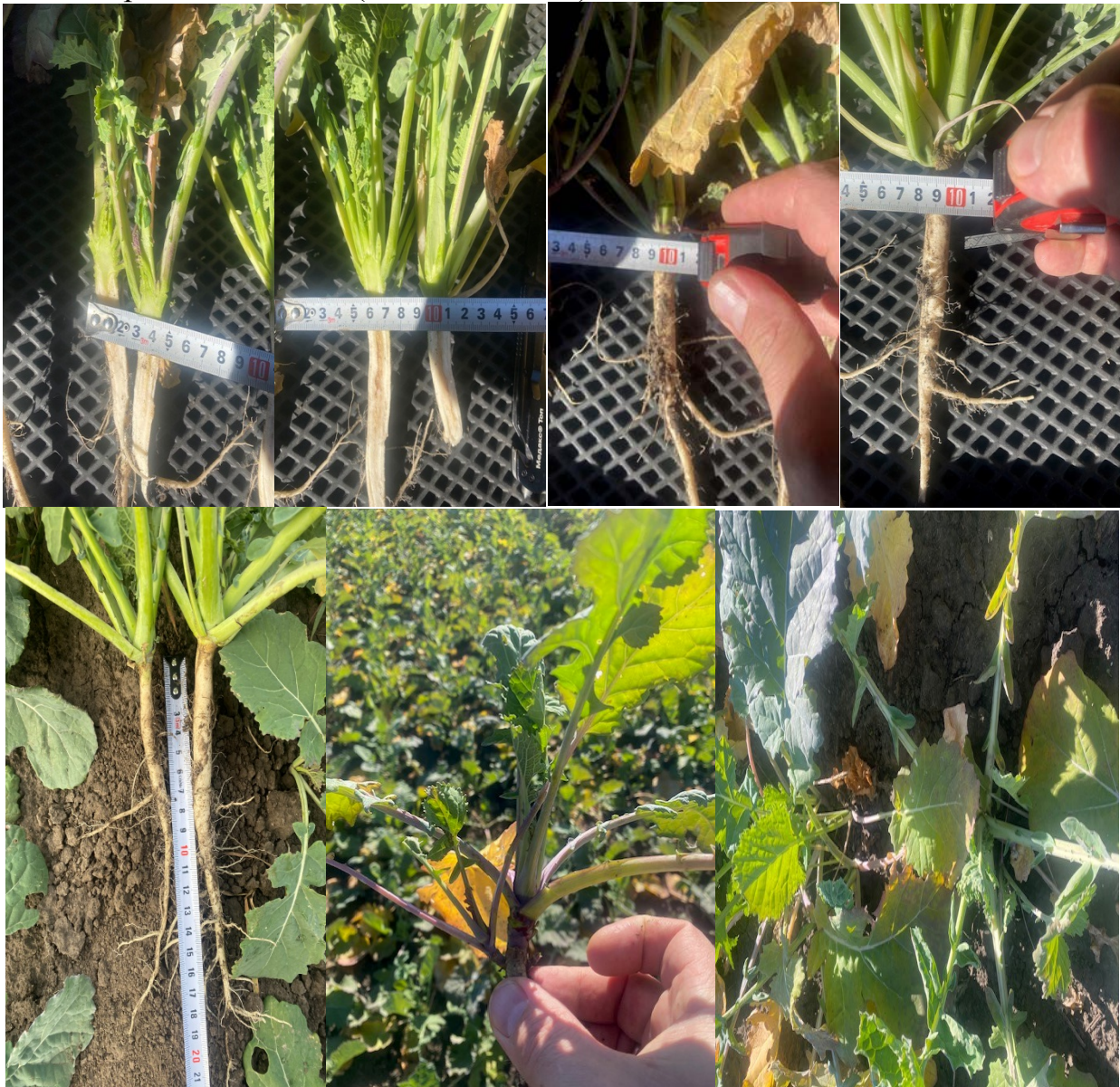
Рис. 3. Облікові морфометричні показники рослин гібриду Абсолют, 2023 рік

15-15-15 (150 кг/га при посіві) що містять загального азоту: 15%, амідного азоту 12,2%, нітратного азоту: 2,8% та додатково оксиду кальцію 2,8% і оксиду сірки 15% на фоні застосування сірковмісної діамофоски (N-10% P-26% K-26% +1S (144 кг/га під оранку)) було досягнуто загальне поліпшення морфометрії рослин (рис. 3) з позиції ідеальної моделі рослин ріпаку для гарантованої успішної перезимівлі рослин, що з огляду на ряд публікацій [2, 5, 7] передбачає у першу чергу співвідношення загального розвитку діаметру кореневої шийки (не менше 10 мм) та довжини кореневої системи (не менше 15 см).