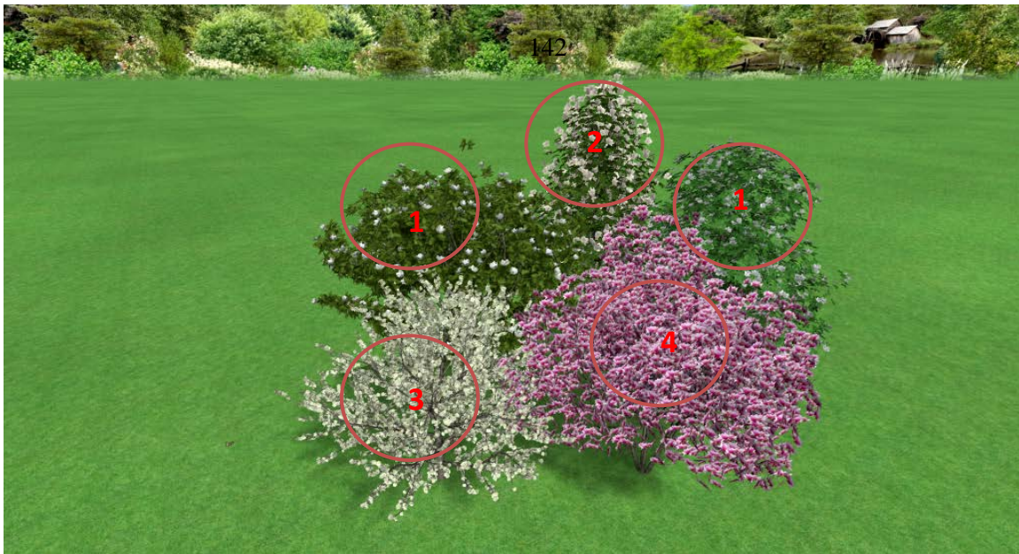
Fig. 4. Angular landscape composition, includes the following types: 1. Magnolia virginiana L. 2. Magnolia grandiflora Michx. 3. Magnolia stellata (Sieb. Et Zucc.) Maxim. 4. Magnolia Soulangeana Soul.