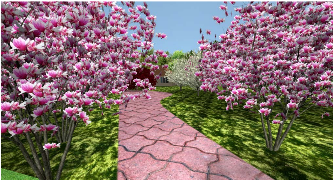
Fig. 5. Using Magnolia Soulangeana Soul. for the formation of a promenade