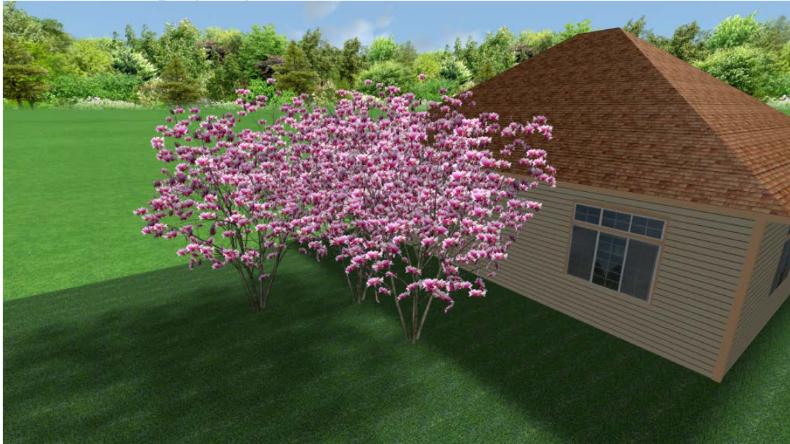
Fig. 2. Magnolia Soulangiana Soul., a group near the house

sequence, creating alleys, etc. Next, we will demonstrate several options of using magnolia in landscaping (Fig. 2-5).