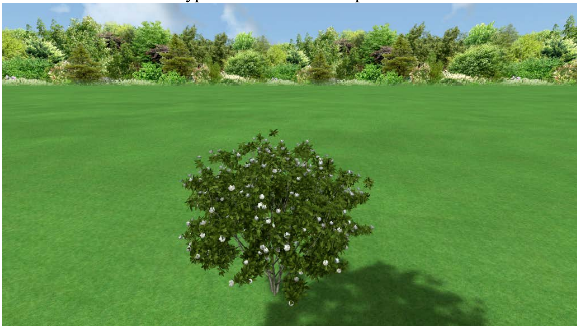
Fig. 3. Magnolia virginiana L., solitaire on the lawn

One of the important conditions for the creation of a complete composition of the genus Magnolia species is the proper location of trees aimed at avoiding drafts. If this condition is not fulfilled, the project will likely fail. Based on the analysis of literature sources and own research, proposals for the use of magnolias on the green areas of different functional types have been developed.